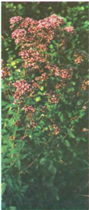
742. Материнка звичайна.